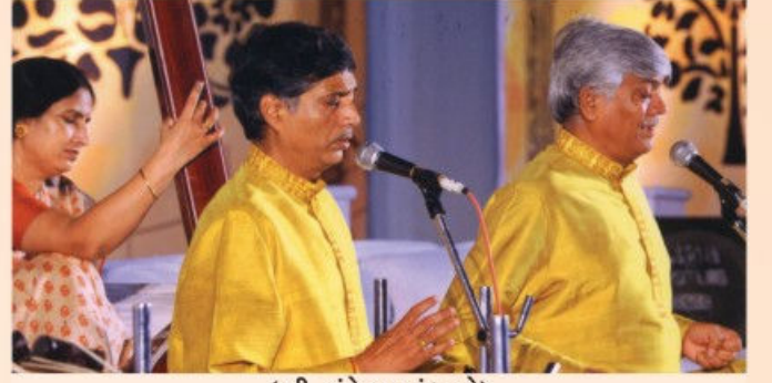
(શ્રી ગુંદેચા બંધુઓ)